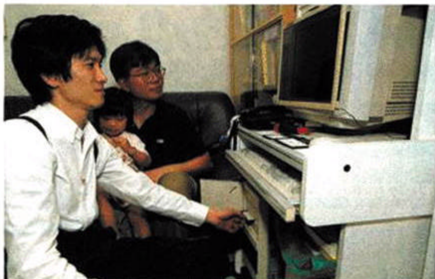
家有一「腦」的郭先生自行加裝Modem卡，結果令部機無法操作，唯有請電腦醫生上門檢查兼維修，十多分鐘便搞掂。