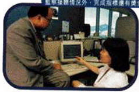
由於要做到起碼一半來電者能夠即時與技術人員直接對話，除了要經常監察接聽情況外，完成指標還有獎金分。