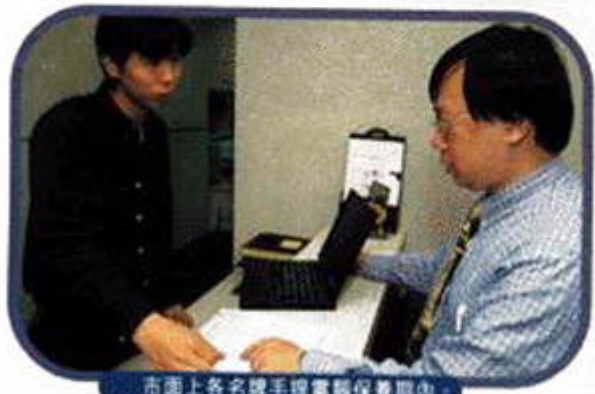
市面上各名牌手提電腦保養期內，都要親自帶回電腦公司維修，想慳錢骨力也不可以。