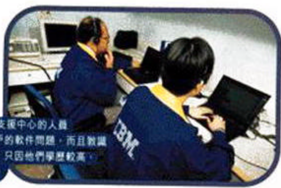
IBM個人電腦支援中心的人員不但可解答用戶的軟件問題，而且對讓用戶點用軟件，只因他們學歷較高，而且訓練足夠。